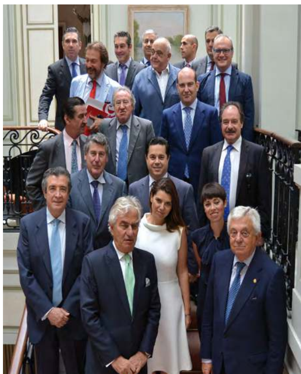
Embajador de España en Colombia, Ramón Gandarias Alonso de Celis