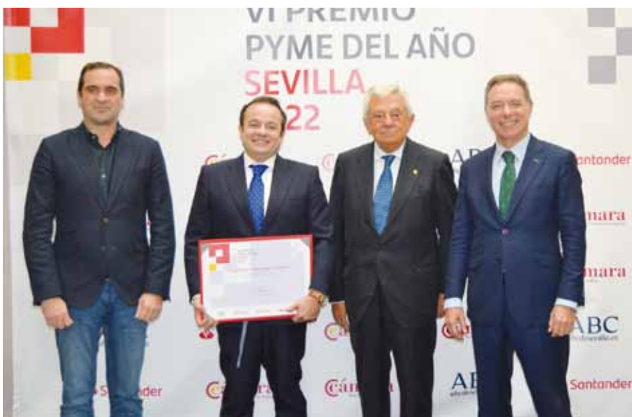
Bebidas Diaz Cadenas.

Su Majestad el Rey entregó el Premio Nacional Pyme del Año 2021 a la empresa Seabery Augmented Technology, de