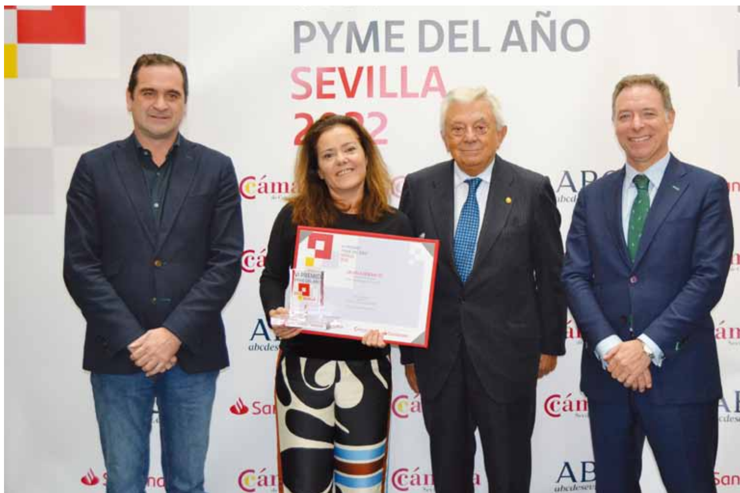
Grupo R. Queraltó.

Con 124 años de trayectoria, Grupo R. Queraltó, se ha convertido en eCommerce Líder en su sector. Su estrategia digi-