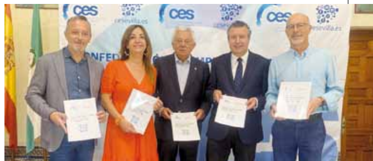
CES y Cámara presentan a PSOE sus propuestas empresariales.

Entre los planteamientos del documento, los empresarios consideran vital conseguir una provincia mejor y más competitiva, capaz de convertirse en una gran generadora de puestos de trabajo, en base a una serie de condiciones que necesitaría de un compromiso efectivo por parte de la Administración Autónoma. Asimismo, esperan que se mantengan los compromisos adquiridos, independientemente de los resultados del 19-J, y que se siga trabajando en reformas de calado, especialmente en el sector público y de normativas.