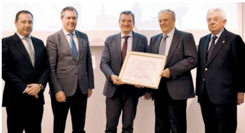
Antigua Cerería del Salvador.