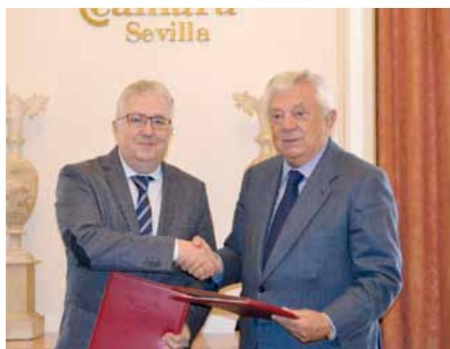
Alcalde del Ayuntamiento de Bormujos, Francisco Miguel Molina Haro.