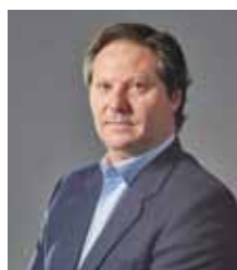
Lappi Perea, Antonio. LAPPI INDUSTRIAS GRÁFICAS