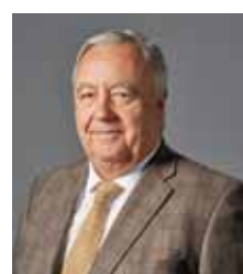
Morilla Rich, Jorge. LAS CASAS DE LA JUDERÍA