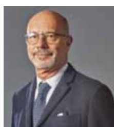
Montero Sines, Antonio. CENTRO DE INVESTIGA- CIÓN Y DESARROLLO EMPRESARIAL