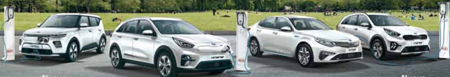
Nuevo Kia E-Soul