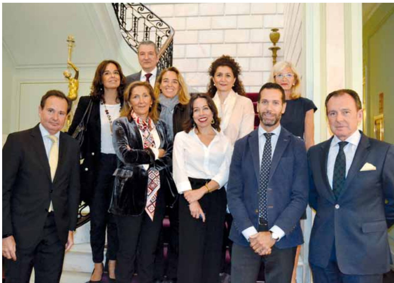
Junta Electoral, y Delegación Territorial designada para el proceso electoral de la Cámara de Comercio de Sevilla.