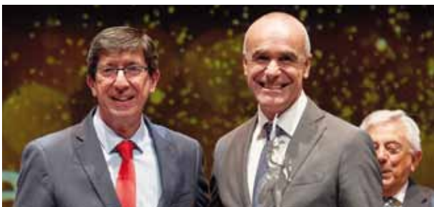
WTTC-World Travel &amp; Tourism.