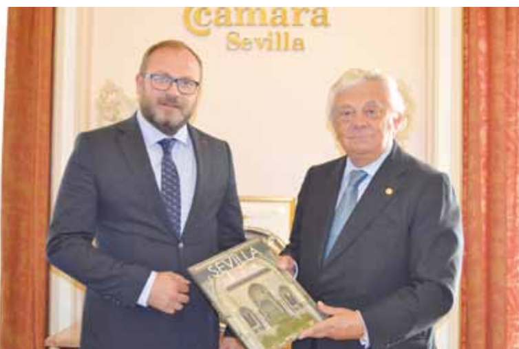
Visita institucional del Cónsul General de Rumanía Bogdan-Mihai Stănescu