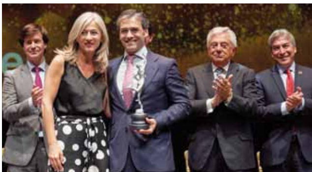
Cartuja Center-Grupo EULEN.