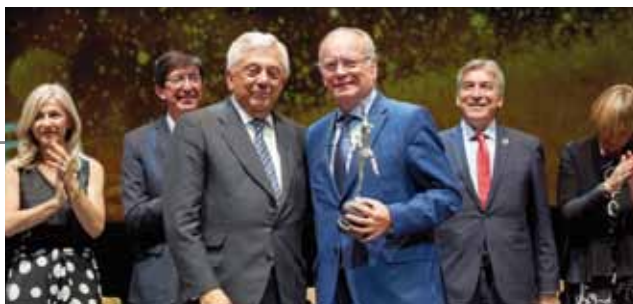
ABC de Sevilla.