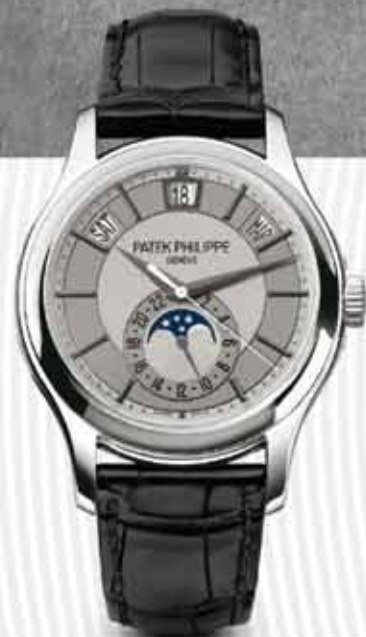
Calendario Anual Ref. 5205G

Sierpes 19-21 · 41004 Sevilla Tel. 954 22 50 28 · www.elcronometro.com