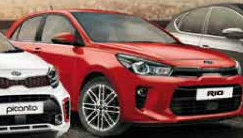
Nuevo Kia Rio Dinamismo & Innovación