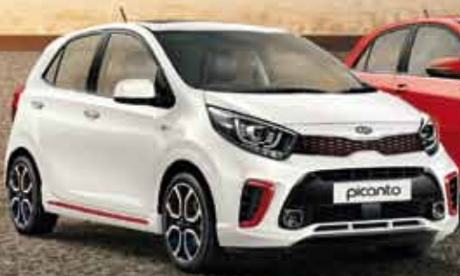
Nuevo Kia Picanto Diseño & Eficiencia