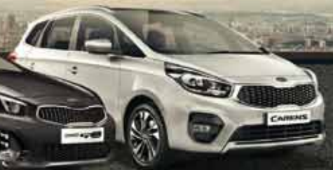
Kia Carens Espacio & Versatilidad