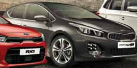
Kia cee'd 5 puertas Totalmente equipado