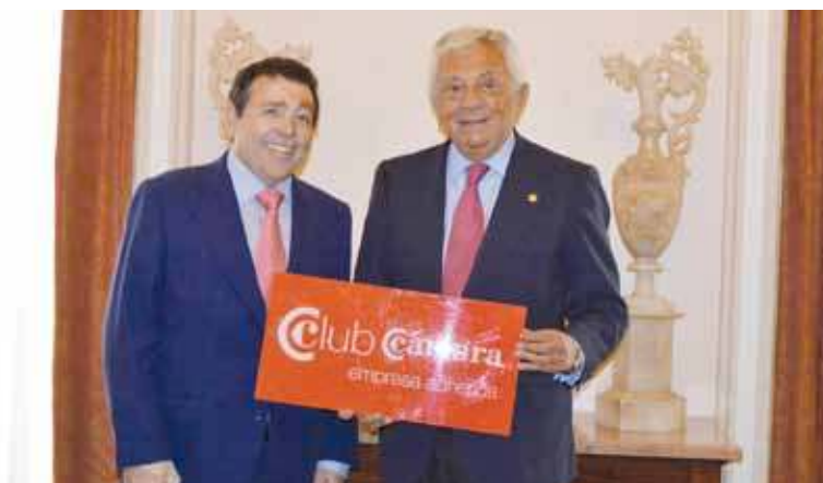
Grupo Antea Prevención.

Cuentan con más de ochenta sedes repartidas por todo el territorio nacional, donde ofrecen servicios propios de clínicas, laboratorios, unidades móviles sanitarias y de formación, todo ello asistido por profesionales cualificados en Medicina del Trabajo y en las tres especialidades en prevención.