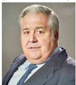
Martín Pozo, Antonio. MARTÍN CASILLAS, S.L.U.