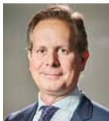
Castilla Bustamante, Pablo Luís. PUERTO DE CUBA EN LIÉBANA, S.L.