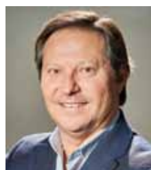
Lappí Perea, Antonio. LAPPÍ INDUSTRIAS GRÁFICAS, S.L.