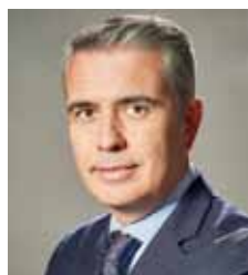
Navarro Leal, Narciso. ÁRIDOS Y RECUPERACIONES, S.L.U.