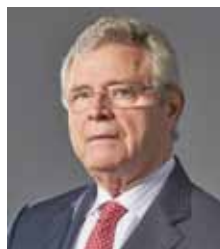
Cardoso Garzón, Manuel. AROMAS ANDALUCÍA, S.L.U.