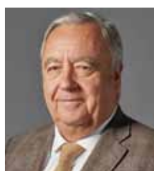
Morilla Rich, Jorge. LAS CASAS DE LA JUDERÍA, S.L.