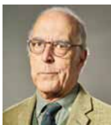
Lahore Camuña, Augusto. GOKUVACA, S.L.